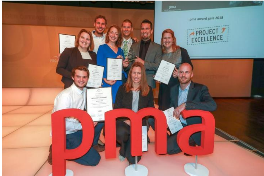
Das IRONMAN Austria-Kärnten Team erhielt als bestes Projekt den pma excellence award 2018.

pma/IPMA®-Zertifizierungen sind national und international als Gütesiegel der Branche anerkannt. Projekt Management Austria (pma) ist mit 1.200 Mitgliedern Österreichs größte Projektmanagement-Vereinigung und ist die offizielle Zertifizierungsstelle der International Project Management Association (IPMA®) in Österreich. pma/IPMA®-Zertifizierungen werden in über 70 Ländern anerkannt und angewandt. Die Zertifizierung bestätigt Projektmanagement-Kompetenzen auf unterschiedlichen Levels und muss alle fünf Jahre erneut nachgewiesen werden. Qualifizierte Projektmanager*innen sind gefragt wie nie. In Österreich gibt es derzeit über 17.500 zertifizierte Projektmanager*innen, international sind es rund 300.000. Tendenz weiter steigend.