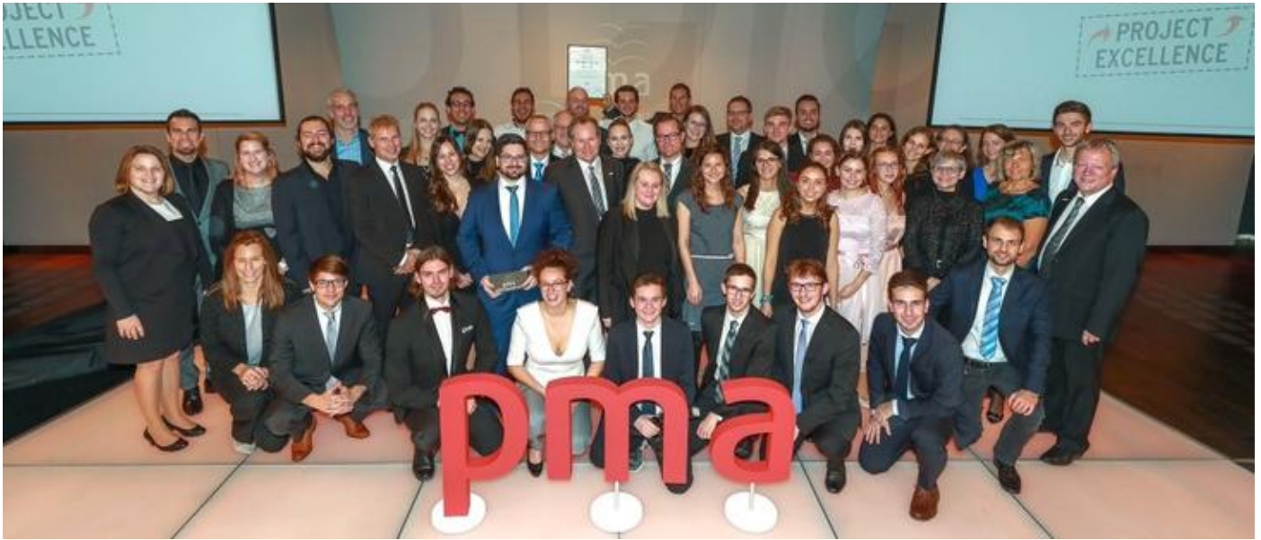
pma awards 2018 - Die mit dem pma award 2018 ausgezeichneten Projektmanager*innen und Projektteams plus pma-Vorstand