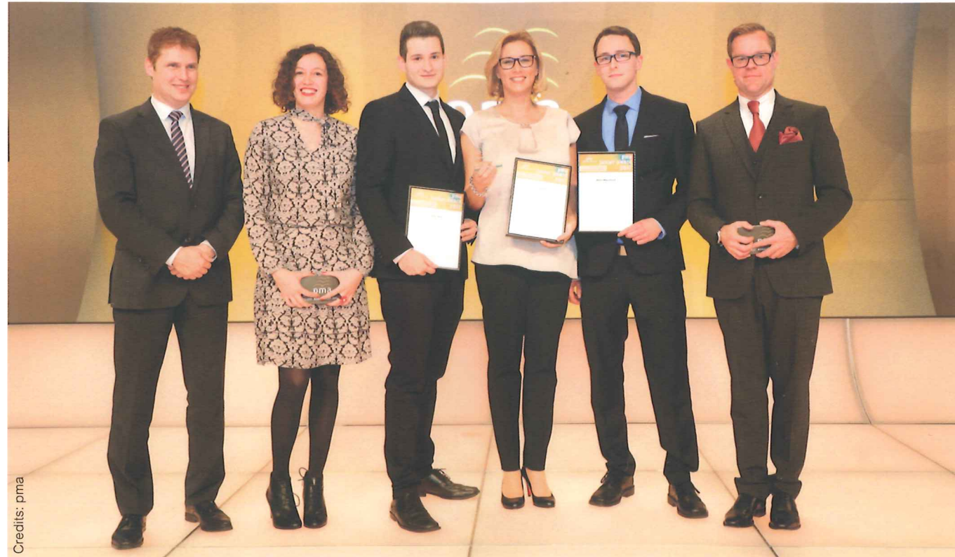
Die PreisträgerInnen des pma young awards 2017.

Viele gemeinnützige Organisationen wurden in den letzten zehn Jahren von PIT-Studierenden unterstützt. „Stimmen gegen Armut“ ist der Slogan des Wiener Spendenparlaments, welches sich für Menschen in Armut einsetzt. Neben der Erstellung einer Datenbanksoftware für Kundendaten und der Einschulung der VereinsmitarbeiterInnen überzeugte das Projektteam bei der Vernissage 2016 vor allem mit dem darüber hinausgehenden Engagement bei weiteren Vereinsaktivitäten. Von der Fachjury und dem Publikum wurde dem Projektteam dafür jeweils der erste Platz verliehen.