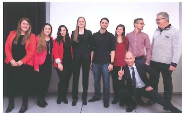
Die Projektgruppe "Wiener Spendenparlament".

Viele gemeinnützige Organisationen wurden in den letzten zehn Jahren von PIT-Studierenden unterstützt. „Stimmen gegen Armut“ ist der Slogan des Wiener Spendenparlaments, welches sich für Menschen in Armut einsetzt. Neben der Erstellung einer Datenbanksoftware für Kundendaten und der Einschulung der VereinsmitarbeiterInnen überzeugte das Projektteam bei der Vernissage 2016 vor allem mit dem darüber hinausgehenden Engagement bei weiteren Vereinsaktivitäten. Von der Fachjury und dem Publikum wurde dem Projektteam dafür jeweils der erste Platz verliehen.